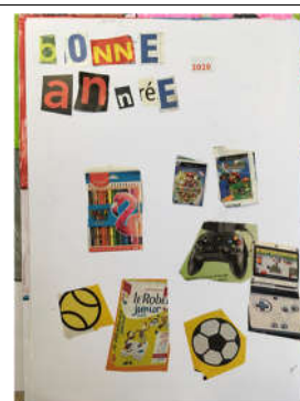
Quatrième de couverture