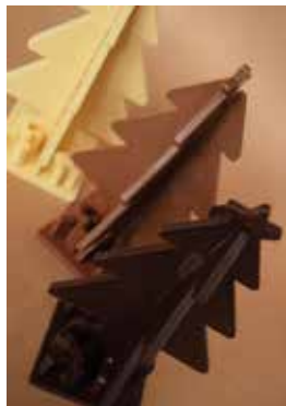
Les sapins 3D