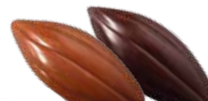
Praliné noisette à l'ancienne