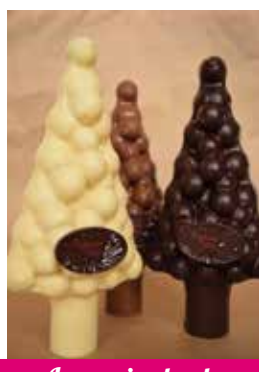
Les sapins boule garnis de friture