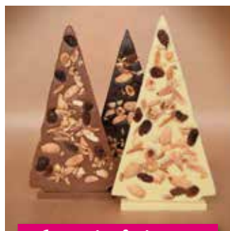
Les sapins fruits secs

Notre collection existe pour la plupart des références en chocolat noir et chocolat au lait (selon photos)