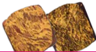
Praliné noix de cajou fleur de sel