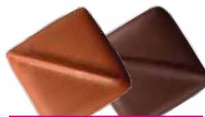
Praliné noix de pécan