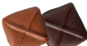
Ganache chocolat 70%