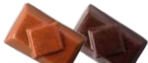
Caramel au baurre salé

Découvrez-les sous forme de ballotins, compositions. Vous trouverez également des minis ballotins pour réaliser vos chemins de table.