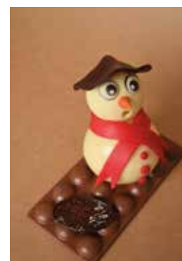
Le bonhomme de neige