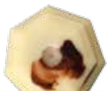
Caramel vanille blanc