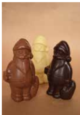
Les Père Noël