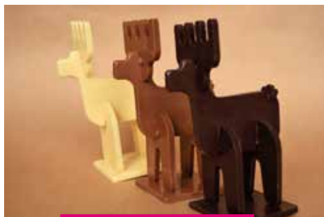
Les Rennes de Noël