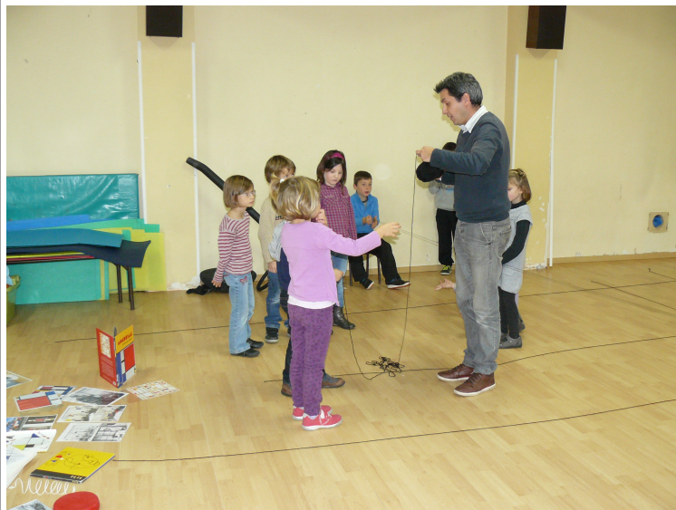
En salle de motricité, un autre atelier était proposé. Il fallait réaliser un grand tableau.