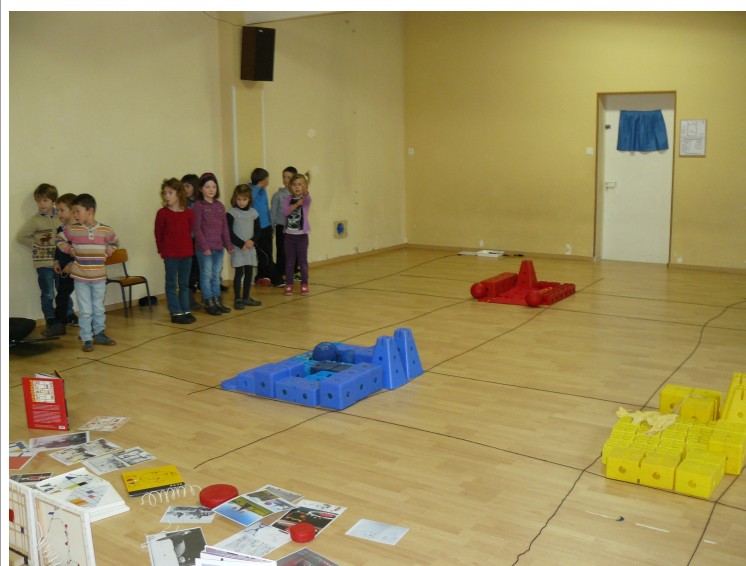
Puis avec des objets rouges, ils ont rempli une case.