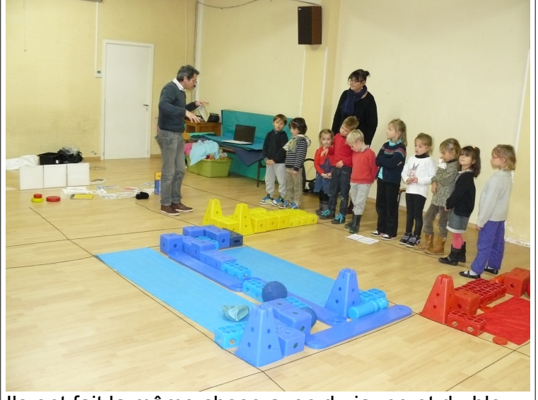
Ils ont fait la même chose avec du jaune et du bleu. On pouvait imaginer des villes, des routes....

Les élèves ont été très intéressés par ces ateliers et ils ont bien participé aux œuvres collectives.