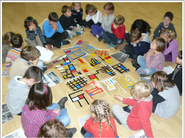
Mis côte à côte, les dessins représentent un grand tableau.