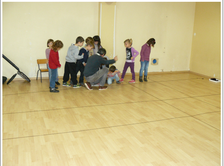
Avec de la laine noire et à l'aide d'un plan, les enfants ont tracé des lignes horizontales et verticales.